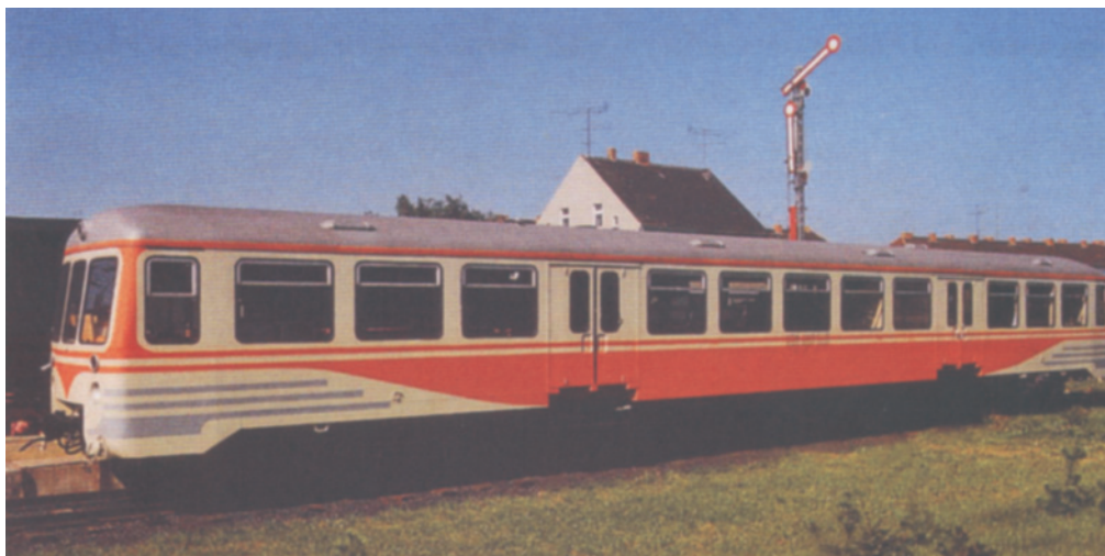
Schienenbus der DR, Epoche III/IV Art.-Nr. 1731

Die 4achsigen Diesel-Leichttriebwagen waren Einzel-Baumuster die in den Jahren 1964 bzw. 1965 vom damaligen VEB Waggonbau Bautzen hergestellt wurden. Ursprünglich als Nachfolger der 2achsigen LVT geplant, wurde eine Serienfertigung nicht realisiert. Im Zuständigkeitsbereich der Reichsbahndirektion Cottbus waren sie bis 1975 bzw. 1978 im Einsatz.