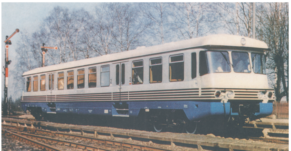
Schienenbus der DR, Epoche III/IV Art.-Nr. 1732

Auslieferung beider Modelle ab 2. Quartal 2010